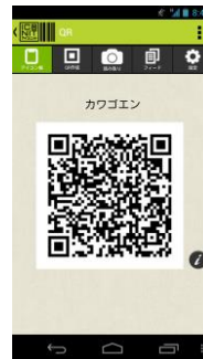
カワゴエンアイコン QRコード